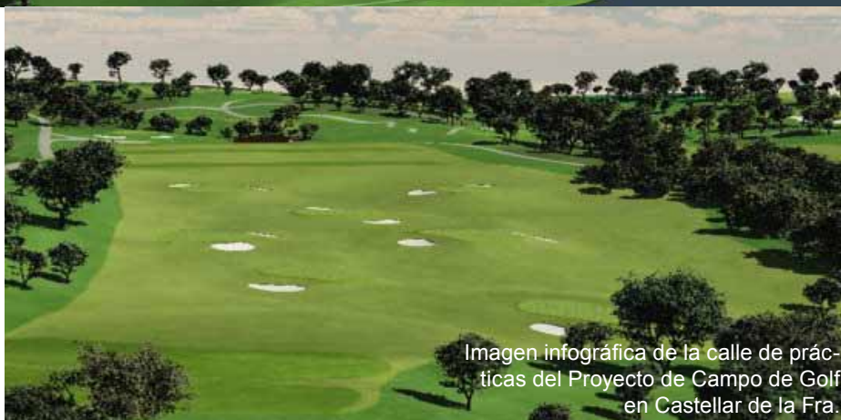
Imagen infográfica de la calle de prácticas del Proyecto de Campo de Golf en Castellar de la Fra.

El grupo Valderrama quiere disponer de la calificación de campo de golf de interés turístico para este nuevo gran proyecto y ha contado para ello con la asistencia y asesoramiento de la empresa consultora RD GOLF CONSULTING SL la cual se ha encargado de preparar toda la documentación técnica necesaria y próximamente se procederá a la presentación del expediente correspondiente ante la Consejería de Turismo de la Junta de Andalucía.