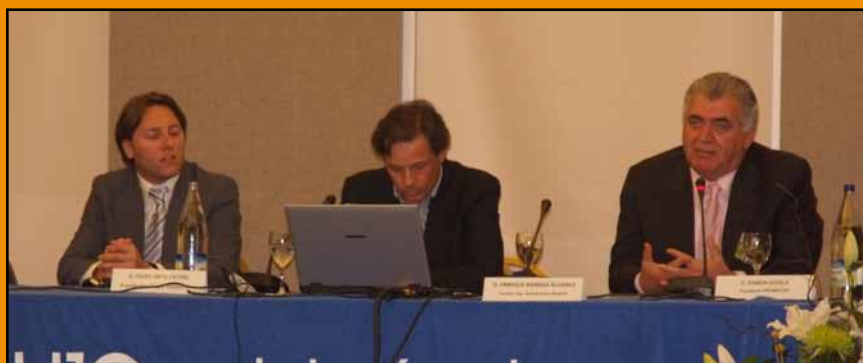
Presentación del vídeo infográfico de Castellar Golf durante las VI Jornadas Internacionales de Golf y Medio Ambiente 2009

El departamento de diseño y multimedia de RD Golf Consulting, S.L. produce el vídeo infográfico del nuevo campo de golf del Grupo Valderrama en el municipio de Castellar.